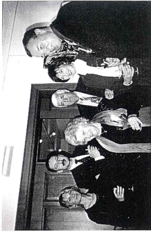
was wird wohl da erzählt, sicher etwas zum Schmunzeln!